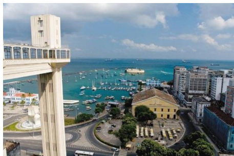
Elevador Lacerda e Merc. Modelo