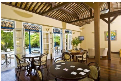
Pousada - Sala de Jogos -