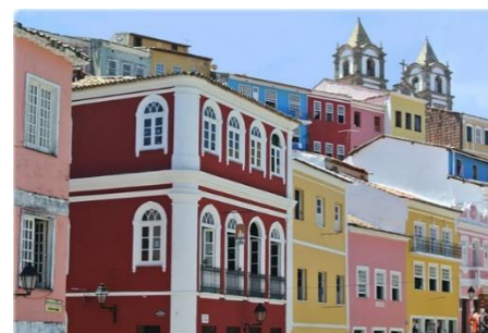
Centro Histórico – Salvador

Localização: O HOTEL SOL BARRA está localizado em frente à praia do Porto da Barra, considerada a melhor da cidade, e com vista para a Baía de Todos os Santos. O Hotel Sol Barra está a poucos metros do Farol da Barra, além da proximidade de museus, do Teatro Castro Alves, Centro Histórico, Pelourinho e Mercado Modelo no pé do Elevador Lacerda, o cartão postal de Salvador.