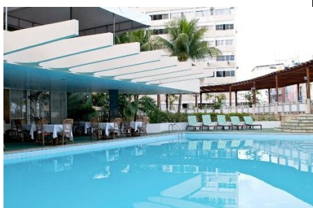
Piscina do Hotel Sol Barra