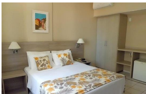
Apto. Standard - Casal