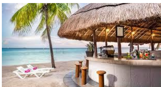
Quiosque na Praia – Bebidas livre

Localização: O complexo Costa do Sauipe Resorts é um grande empreendimento turístico-hoteleiro, localizado em uma área privilegiada da Costa dos Coqueiros, cercada por áreas preservadas da Mata Atlântica e com fácil acesso às praias. A área do complexo estende-se por 176 hectares e está a 76 Km do Aeroporto de Salvador, seguindo pela Estrada do Coco, passando por Camaçari, Guarajuba e pela Praia do Forte.