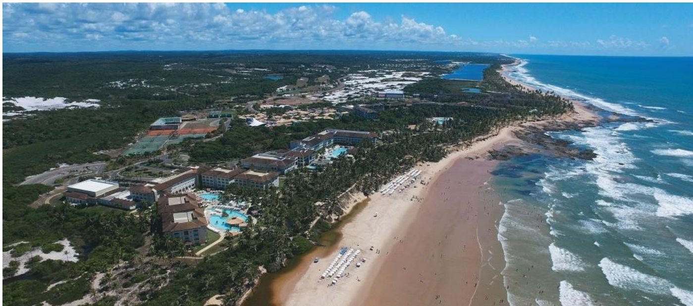
Vista aérea do complexo Costa do Sauipe Resort – Litoral Norte – Salvador BA