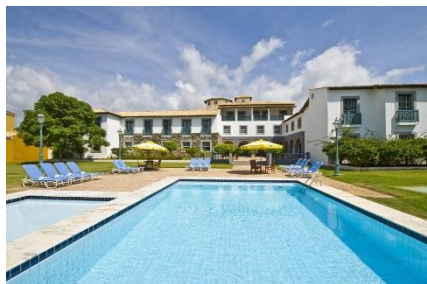
Costa Sauipe – Piscina Adulta