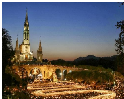
Santuário Nossa Senhora de Lourdes