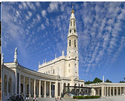
Santuário de Nossa Senhora de Fátima