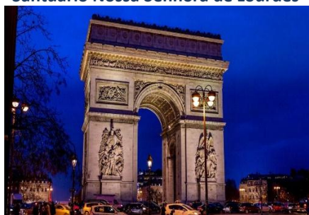
Arco do Triunfo