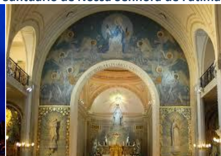
Capela da Medalha Milagrosa