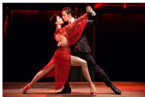
Buenos Aires - Show de Tango