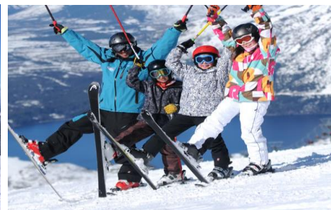
Bariloche - Estação de ski