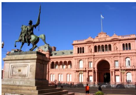
Casa Rosada – Palácio do Governo