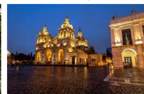
Córdoba - Argentina