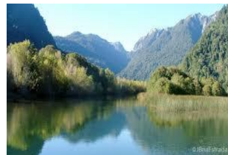
Lagos Andinos – Vista Panorâmica