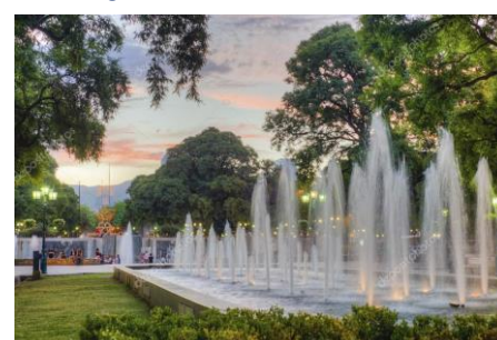
Mendoza - Argentina