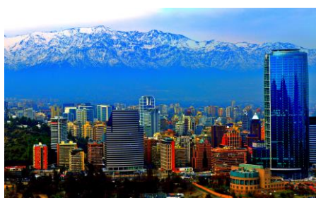
Santiago do Chile