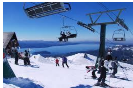
Bariloche – Cerro Catedral