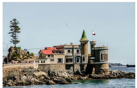
Vina Del Mar - Argentina