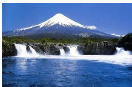
Vista do Vulcão Osorno