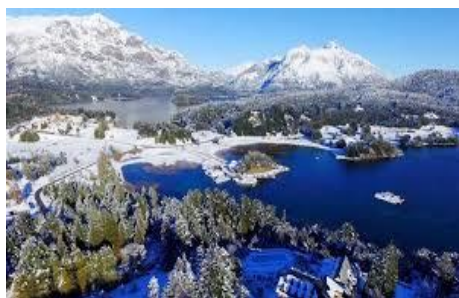
Bariloche – Vista Panorâmica