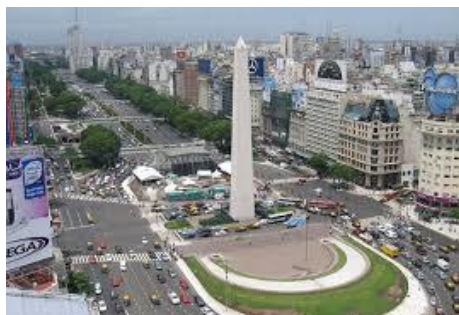
Buenos Aires – Obelisco

PERÍODO DA VIAGEM: 14 à 28.10.21 - 15 Dias e 11 Noites – Rodoviário