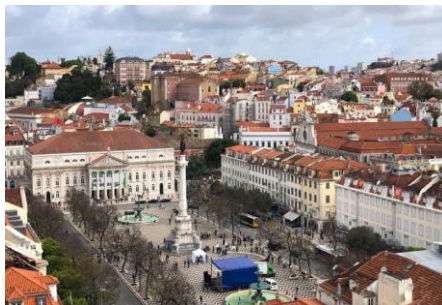
Praça do Rossio - Lisboa