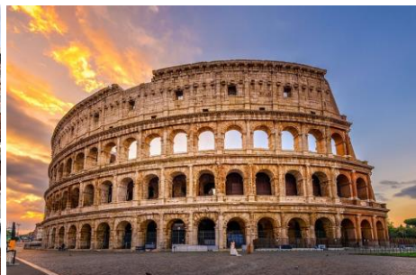
O Coliseu - Roma