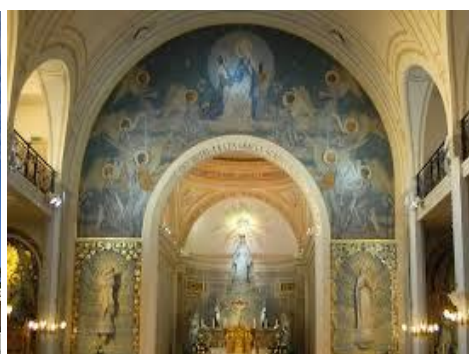
Capela da Medalha Milagrosa