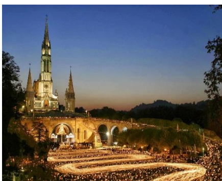
Santuário Nossa Senhora de Lourdes

Período da Viagem Dia 16 à 29.05.23 – 14 Dias